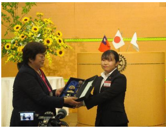
◆ローターアクト点鐘 ローターアクトソング 斉唱